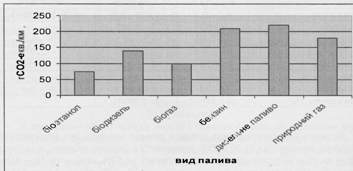
Рис. 2. Питомі викиди парникових газів при використанні моторних палив Джерело: [7]

а використання біодизелю – у 1,5 рази менше, ніж при використанні бензину і дизпалива (рис.2).