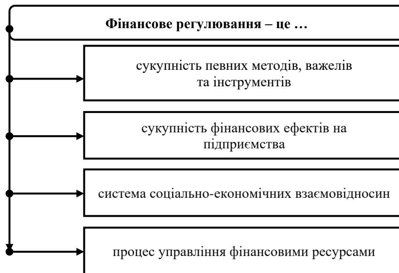
Рис. 1. Групування переконань науковців щодо економічної природи фінансового регулювання

Отже, як бачимо, трактування різними вченими поняття “фінансове регулювання” варіює від узагальнюючих суджень до досить дискусійних положень окремих авторів, які зводять суть такого регулювання до дії лише порізних методів чи засобів. Тому доречно об’єднати ці погляди в певні групи (рис. 1).