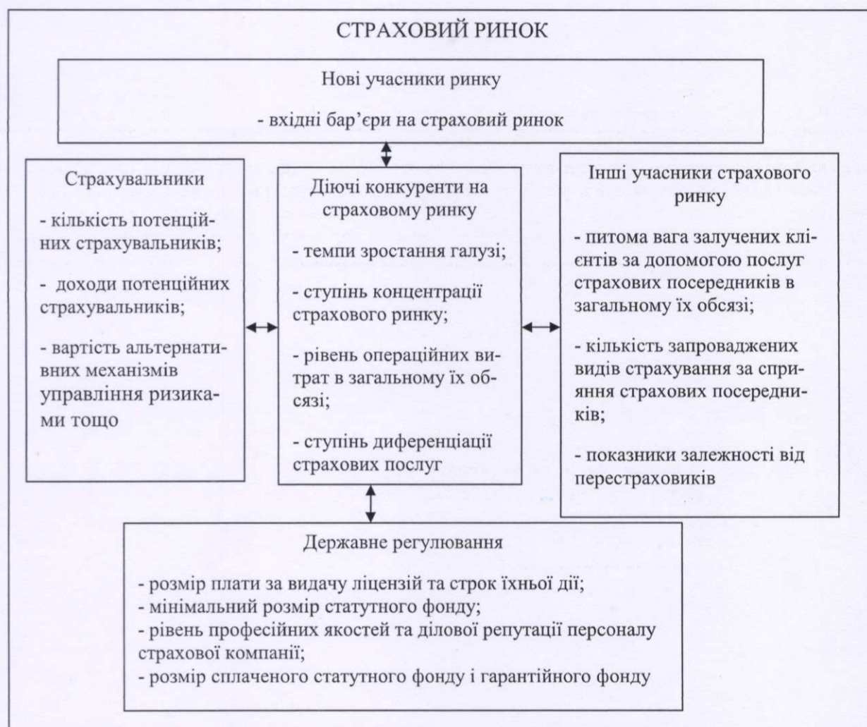
Рис. 1. Чинники та індикатори аналізу конкурентної боротьби на страховому ринку України

Наведений рисунок 1 демонструє п'ять чинників (діючі конкуренти, інші учасники страхової галузі, державне регулювання, страхувальники та нові учасники ринку), які визначають привабливість страхового ринку, а також основні характеристики, за допомогою яких можна визначити їхню значущість для фінансової безпеки окремої страхової компанії.