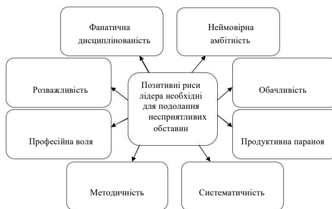
Рис. 1. Позитивні риси лідера необхідні для подолання несприятливих обставин [сформовано автором за даними [5]]