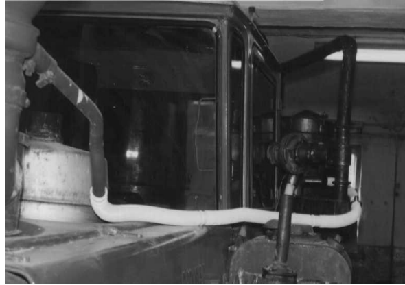
Рис. 3. - Встановлення газогенераторної установки на трактор ДТ-175С.

Для виконання цього завдання на тракторі ДТ-175С зроблені наступні конструктивні зміни (див. рис. 3):