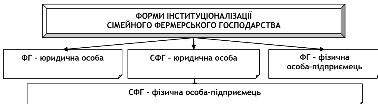
Рис. 1. Форми розвитку сімейного фермерства

Відповідно до правової формалізації в ринковому механізмі господарювання на сьогодні виокремлюється чотири форми інституціоналізації фермерського господарства (рис. 1).