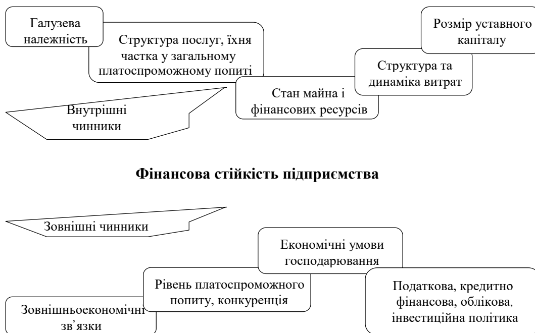
Рис. 2. Чинники впливу на фінансову стійкість підприємства [5; 11; 12]

гається завдяки позитивній динаміці основних економічних та фінансових показників. Зовнішня стійкість визначається стабільністю економічного оточення, зокрема постачальників, покупців, конкурентів, державних органів, фінансових установ. Загальна стійкість, яка складається із внутрішньої та зовнішньої, характеризується постійним перевищенням надходжень коштів над їх витрачанням. За часовою ознакою виділяють тактичну та стратегічну стійкість. Своєю чергою, тактична стійкість забезпечується балансом між поточними ресурсами, які підприємство отримує, та ресурсами, які споживає, з урахуванням циклічності попиту. Стратегічна спрямована на досягнення довгострокових цілей в умовах ризику та невизначеності, а також забезпечується відповідністю темпів розвитку підприємства темпам розвитку ринку.