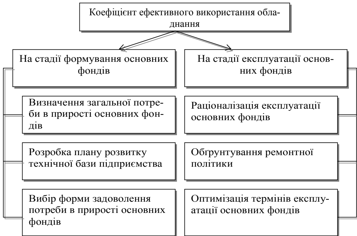
Рис. 2. Завдання управління основними фондами підприємства

За умов ринкової економіки процес господарювання в цілому має передбачати достатні економічні стимули для забезпечення ефективного управління використанням основних засобів, усього майна підприємств. Дійова система таких колективних та індивідуальних економічних стимулів на підприємствах різних галузей народного господарства України поки що перебуває тільки на стадії становлення й розвитку.