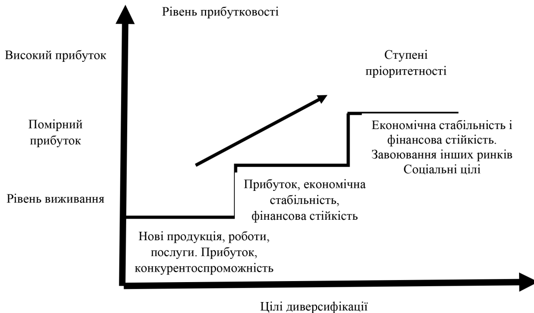
Рис. 2. Пріоритет цілей диверсифікації [розроблено на підставі [1]]

Кінцевий результат стратегічної діяльності диверсифікованої фірми здається оманливо простим. Це – комбінація нових видів продукції, ринків, технологій, що розробляються і реалізуються у фірмі з метою підвищення економічної ефективності діяльності. Пе-