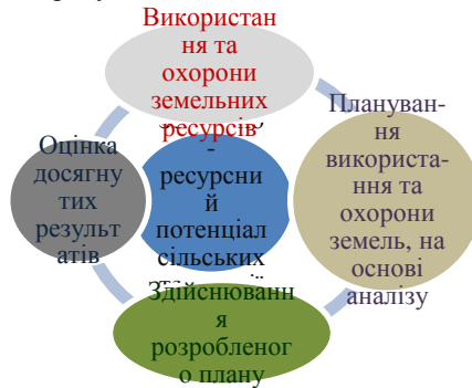
Рис. 1. Цикл регулювання процесу управління земельно-ресурсним потенціалом

Виникає проблема щодо розробки методологічних основ дослідження управління земельно-ресурсним потенціалом сільських територій, яка характеризується низкою ключових моментів (рис. 1).