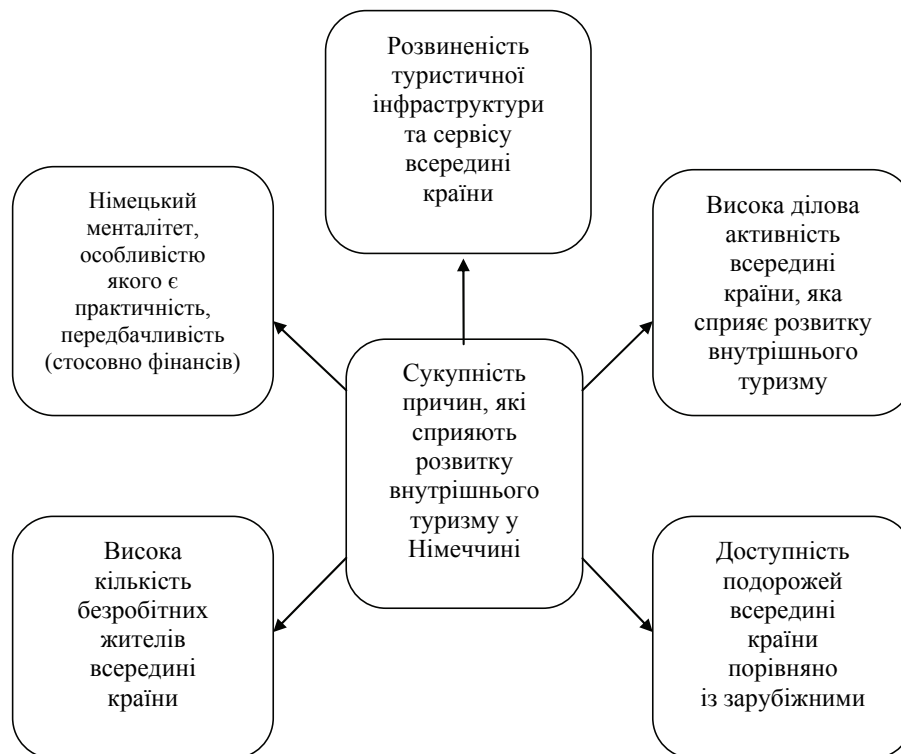
Рис. 2. Сукупність причин, які сприяють розвитку внутрішнього туризму у Німеччині [8].

З визначних пам'яток для туристів буде цікавий замок Бранітц із прилеглим до нього парком, який розташований на півдні міста. Резиденцію побудували на спецзамовлення князя Германа фон Пюклер-Мускау, який був однією з небагатьох ключових фігур країни в XIX ст. Це був письменник, мандрівник і землевласник, а також ландшафтний дизайнер при Прусьському дворі. Споруда була побудована у стилі бароко, а проект до нього приготував архітектор з Дрездена Готфрід Семпер, який спроектував Дрезденську оперу.