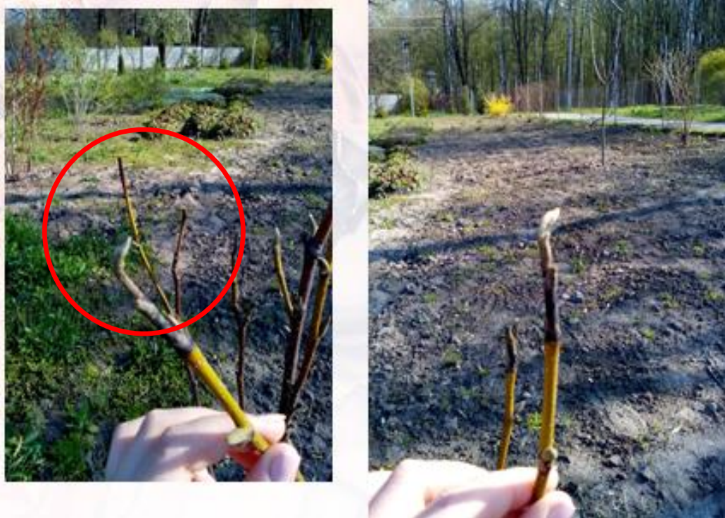
Рис. 2. Обмерзання однорічних пагонів Магнолії Суланжа

Найменшою зимостійкістю в умовах біостаціонару ВНАУ (5 балів) відзначається магнолія трипелосткова ( M. tripetala ), ураження