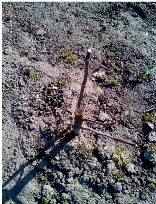
Рис. 3. Обмерзання багаторічних пагонів Магнолії трипелосткової

рослини становило до рівня снігового покриву (майже 80 % габітусу), (рис. 3).