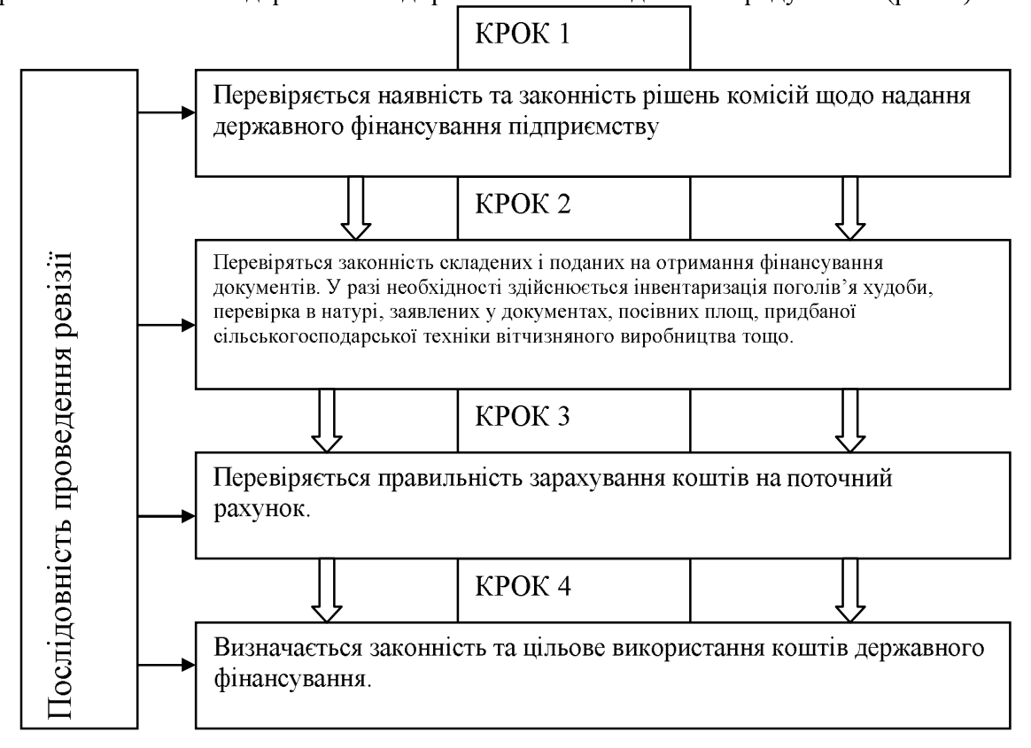
Рис. 1. Узагальнена методика проведення фінансового контролю отримання та використання державного фінансування сільськогосподарським підприємством

Загальна методика контролю законності та цільового використання коштів державної підтримки сільськогосподарськими підприємствами складається з ряду етапів (рис. 1).