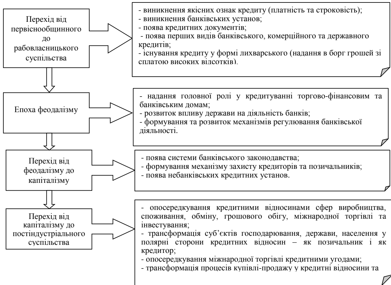
Рис. 1. Етапи розвитку кредитних відносин у суспільстві

теоретико-методологічних засад і видів кредиту та визначення його впливу на розвиток галузей економіки, зокрема, та соціально-економічних процесів у цілому. У процесі дослідження нами систематизовано основні етапи розвитку кредитних відносин (рис. 1).