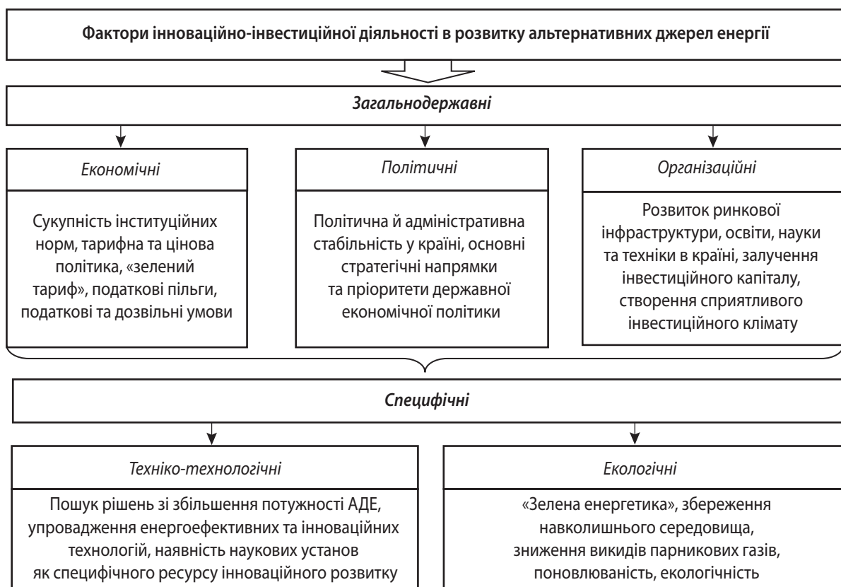
Рис. 3. Фактори інноваційно-інвестиційної діяльності у розвитку альтернативних джерел енергії

У країнах, які проводили різноманітні заходи з розвитку альтернативних джерел енергії, уже можна спостерігати позитивні результати. Накопичено