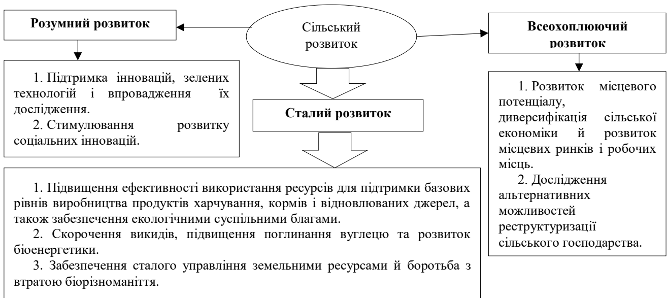
Рис. 2. Сільський розвиток у контексті Стратегії «Європа 2020»

Такий підхід став можливий завдяки багатьом рокам розвитку ринкової економіки, насичення ринку, еволюційного відбору кращих компаній та реалізації через економічний потенціал своїх країн. Вигоди від євроінтеграції полягають, насамперед, у нівелюванні сучасних адміністративних бар'єрів між країнами, які стоять на перешкоді активізації економічної співпраці, перетоку товарів, послуг, капіталу, робочої сили тощо [4, с. 95]. Це не означає, що ці бар'єри блокують окремі потоки повністю, але вони суттєво їх ускладнюють і знижують їхні обсяги, які потенційно можуть бути значно вищими.