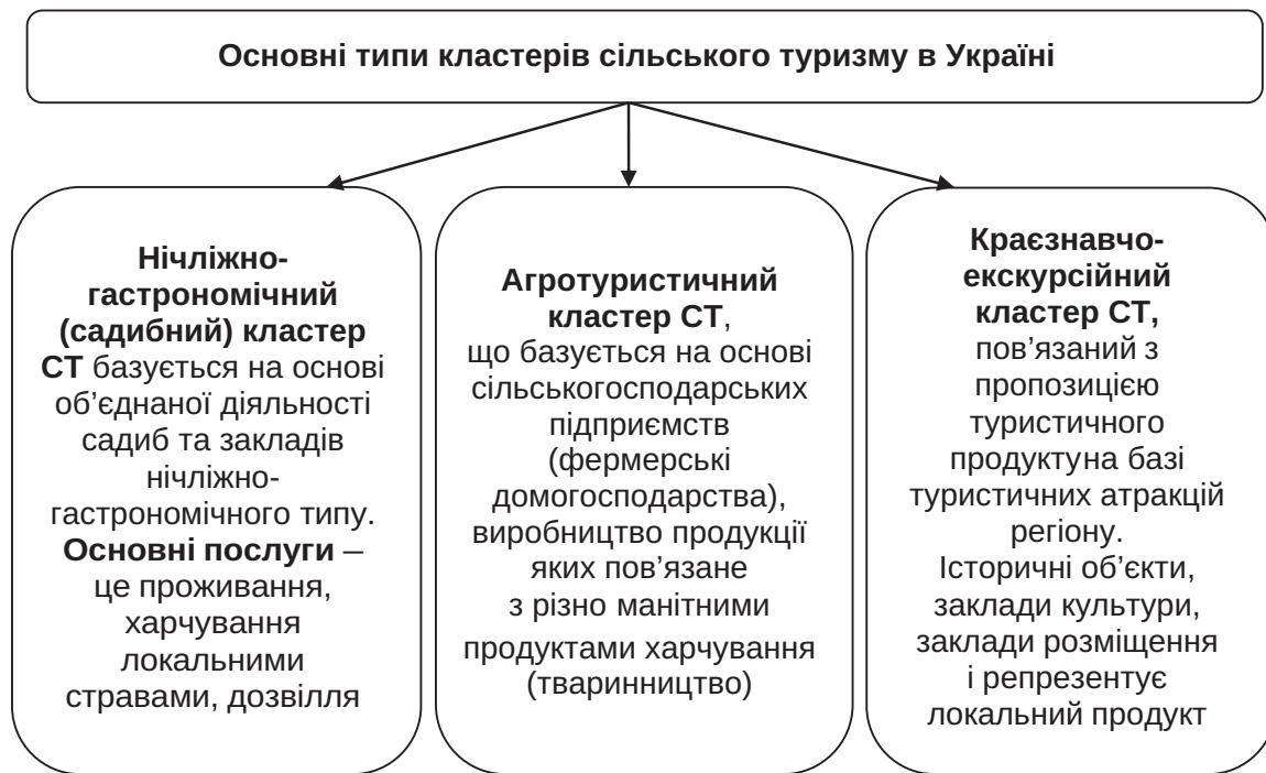
Рис. 3. Основні типи кластерів сільського туризму в Україні