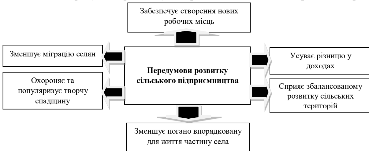
Рис. 1. Передумови розвитку сільського підприємництва

Ключові передумови розвитку підприємництва на селі зображено на рис. 1.