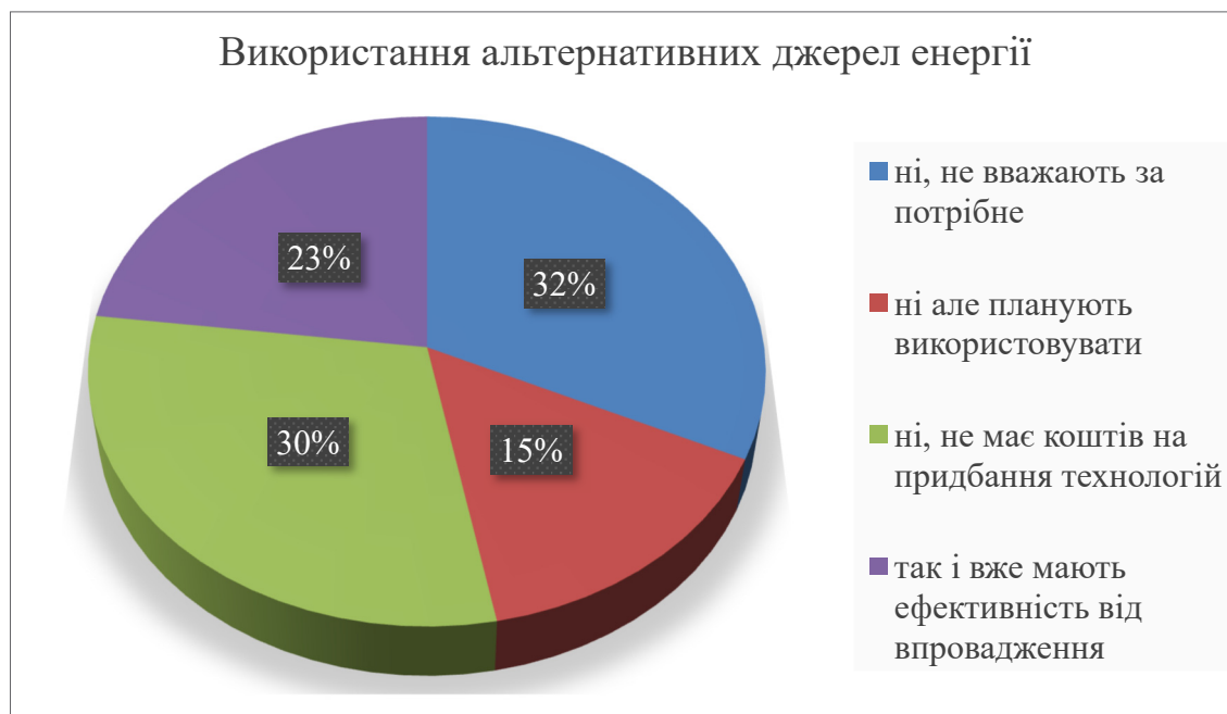
Рис. 2. Результат опитування

Повітря-повітря. Тут енергія повітря безпосередньо потрапляє в тепловий насос та застосову-