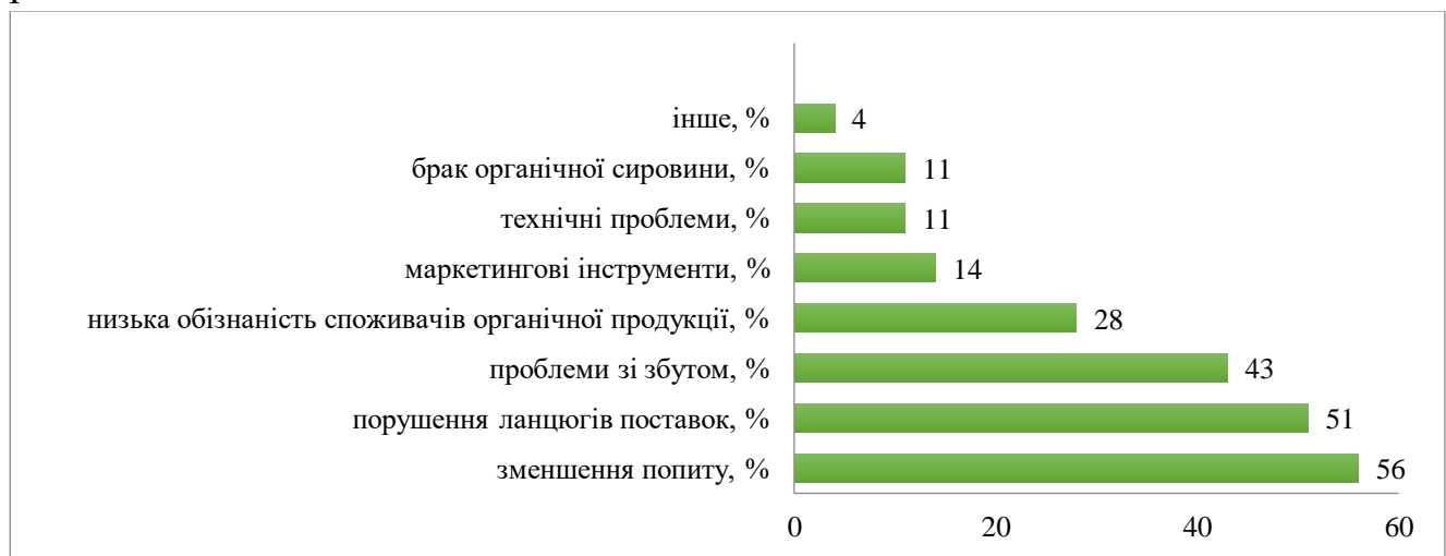
Рис. 4. Проблеми збуту органічної продукції в Україні 2022-2023 рр., % опитаних

Основні проблеми збуту органічної продукції в Україні представлені на рис. 4.