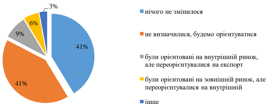
Рис. 3. Зміна стратегії збуту виробників органічної продукції в Україні у 2022–2023 рр., % опитаних

За результатами проведених опитувань вітчизняні органічні виробники під час збуту власної продукції орієнтуються на попит (рис. 3.).