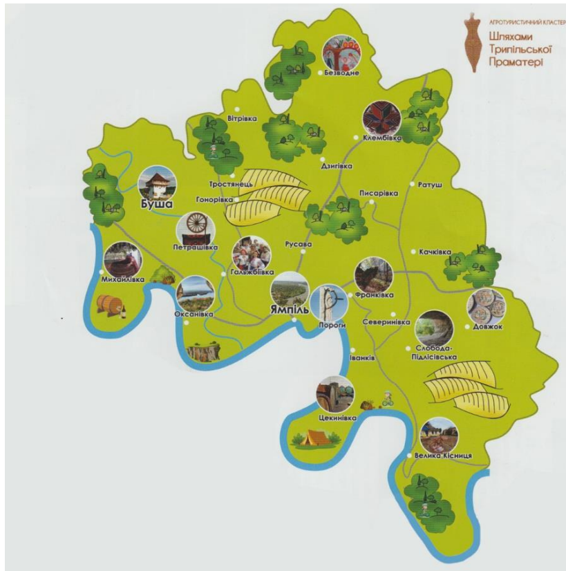
Рис. 2. Діючі локації Європейського культурного шляху «Шляхами Трипільської Праматері» по території Ямпільського району

Проект «Шляхами Трипільської Праматері» має великий потенціал для розвитку туристичної галузі України та може стати важливою складовою Європейського культурного простору. Він сприятиме не лише збереженню та популяризації унікальної культурної спадщини, але й розвитку економічного потенціалу регіонів, де розташовані ці історичні об'єкти. Залучення міжнародних інвесторів, а також активна співпраця з європейськими партнерами дозволять створити цілісну, доступну та цікаву туристичну пропозицію для збереження культурної спадщини, охорони археологічних пам'яток і їх інтеграція в туристичні маршрути, що дозволить зберегти спадщину Трипільської цивілізації для майбутніх поколінь. Економічний розвиток туризму сприятиме створенню нових робочих місць в регіонах, покращенню інфраструктури та залученню інвестицій та залучатиме міжнародну увагу, бо проект може стати одним з важливих туристичних брендів, який приверне міжнародних туристів і зробить Україну важливою культурною точкою на карті Європи.