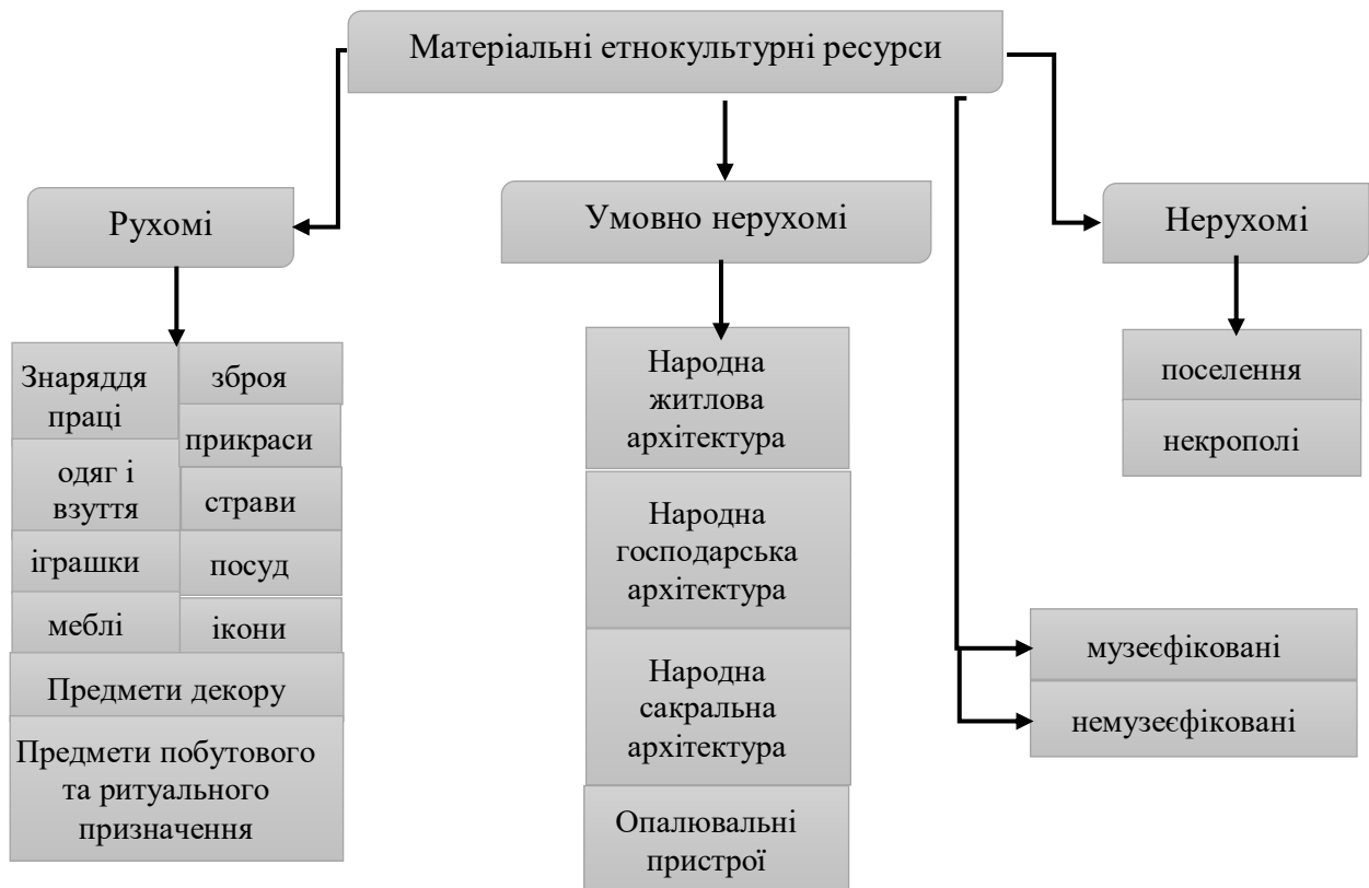
Рис. 1. Класифікація матеріальних етнокультурних туристичних ресурсів

Матеріальні етнокультурні ресурси є важливою складовою частиною внутрішніх туристичних ресурсів України. Вони охоплюють різноманітні об'єкти та елементи, які відображають культурну та етнічну спадщину національних груп, історичні традиції та специфіку життя різних народів.