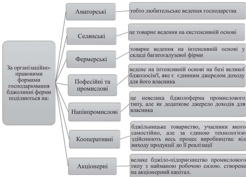
Рис. 3. Типи господарств бджільництва за організаційно-правовими формами

— племінні — для розмноження, поліпшення і виведення бджіл певної породи, зберігання генофонду