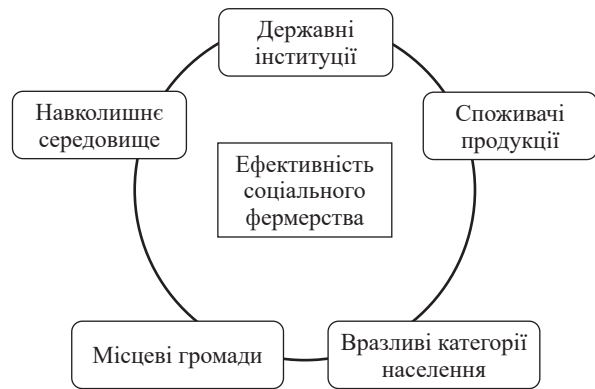
Рисунок 1 – Напрями прояву ефективності соціального фермерства

В умовах інтеграції сільського господарства України, роль соціального фермерства проявляється через корисність для різних суб'єктів та інституцій (рис. 1).