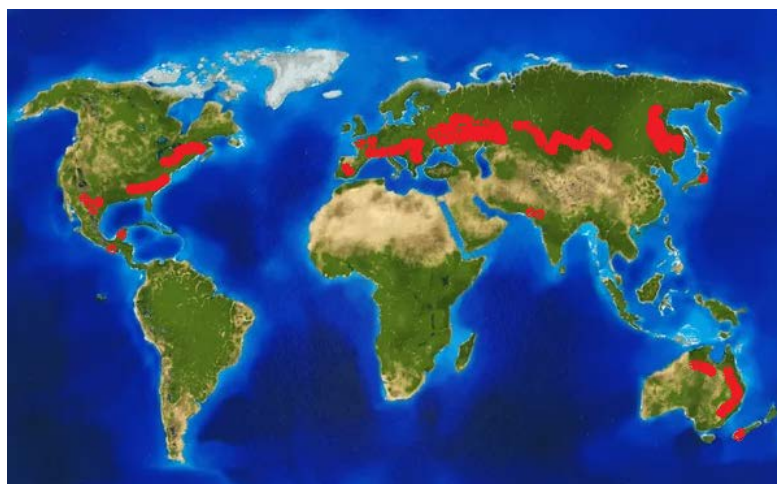
Рис. 1. Природний ареал поширення роду Clematis L.

забезпечені оптимальним освітленням. Чагарникові форми, зокрема напівчагарники й чагарнички, демонструють високу стійкість до несприятливих умов, таких як посуха й низькі температури. Їхні добре розвинені кореневі системи дозволяють ефективно освоювати глибокі шари ґрунту, забезпечуючи рослини необхідною вологою та поживними речовинами [8].