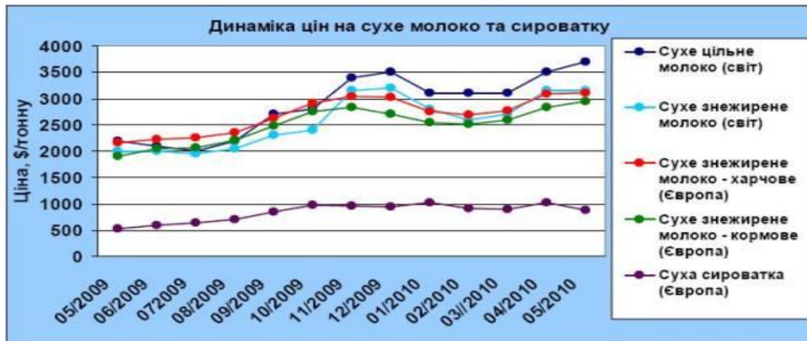
Рис. 2. Динаміка цін на сухе молоко та сироватку.

2010 року у порівнянні з аналогічним періодом минулого року. Наприкінці травня ціни стабілізувалися. Однак оператори ринку очікують впливу на ринок від продажі сухого знежиреного молока з інтервенційних запасів. Об'єм продаж - близько 130 тисяч тонн - має потенційну можливість вплинути на ціни, оскільки становить 12% від загального обсягу виробництва сухого знежиреного молока країнами ЄС-27 у 2009 році.