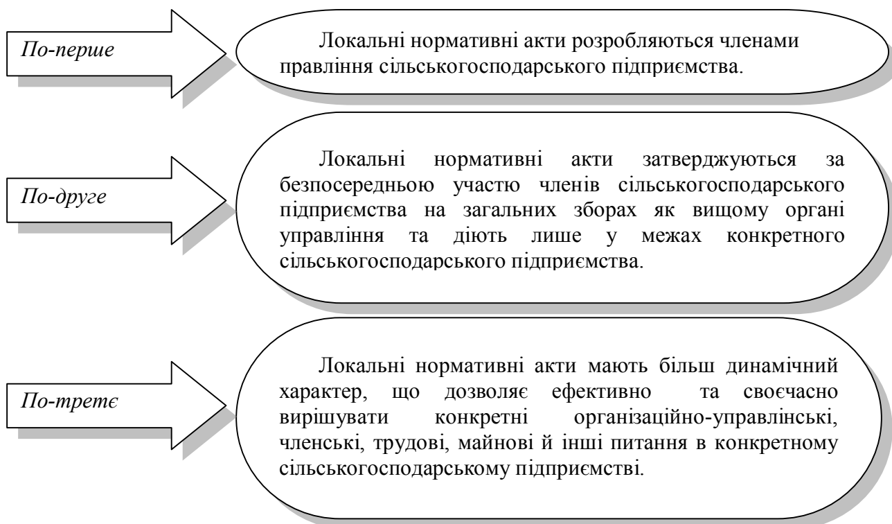
Рис. 2. Особливості внутрішньогосподарських локальних нормативних актів сільськогосподарських підприємств [Розроблено автором на основі [6, с. 158]]

До недоліків внутрішньогосподарського контролю сільськогосподарських підприємств можна віднести його обмеженість окремими тематичними перевірками без системного вивчення господарських операцій і їх процесів за документами, зосередженість на перевірці умов і процесів виконання рішень. Попередній та поточний контроль концентрується, головним чином, на надходженні документів до бухгалтерії, а не на санкціонуванні (наданні дозволів) вчинення операцій і підписанні відповідних документів керівниками структурних та функціональних підрозділів [14, с. 70].