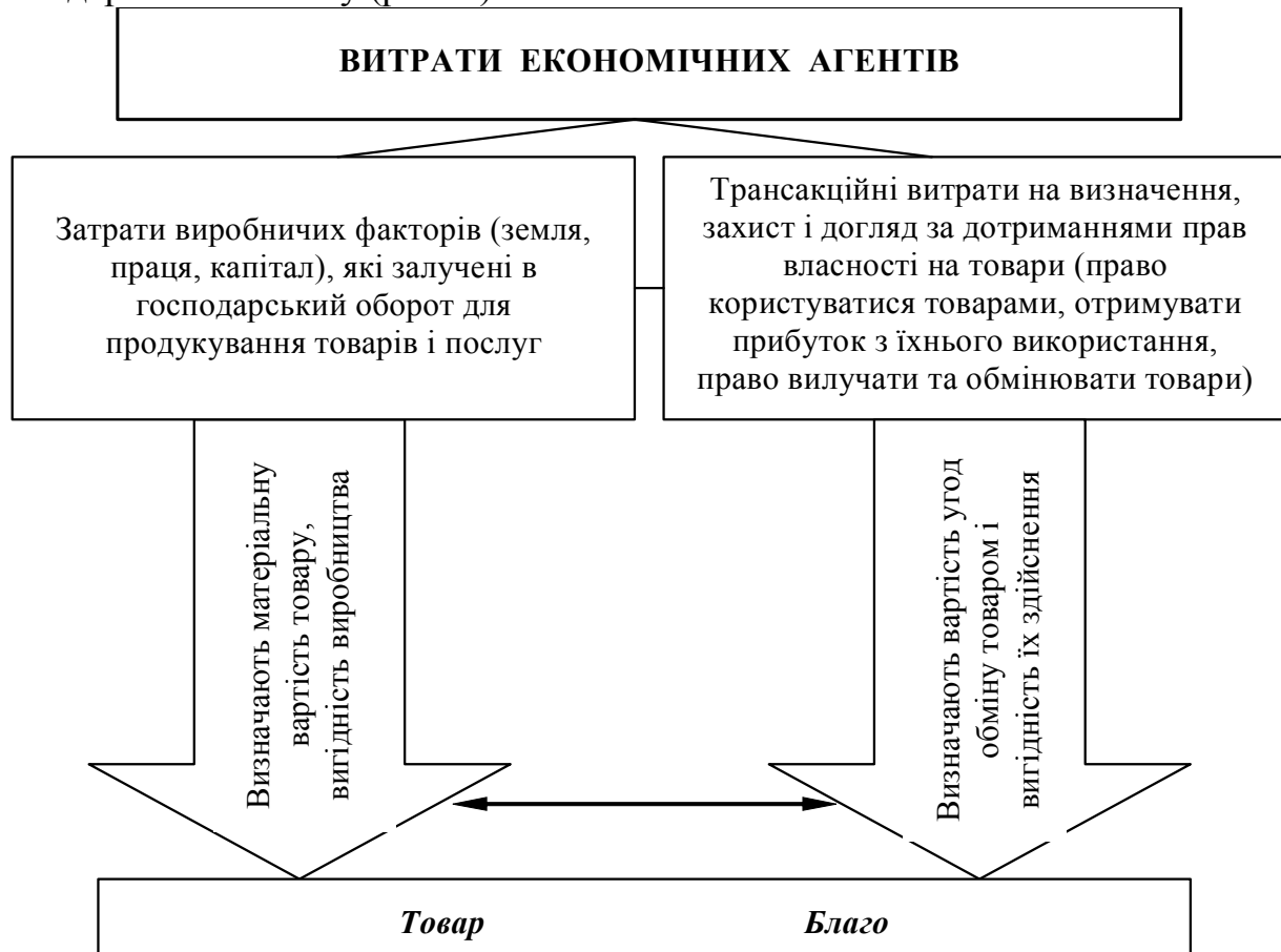
Рис. 2. Структура витрат господарського обміну з урахуванням трансакційних*

Вважаємо, що трансакційні витрати є особливими за змістом і значимістю, що зумовлює специфічність підходів до усвідомлення їх структури, яка змінюється під впливом мінливості інституціональних умов ринку. Пропонуємо схематично зобразити структуру витрат у процесі господарського обміну (рис. 2).