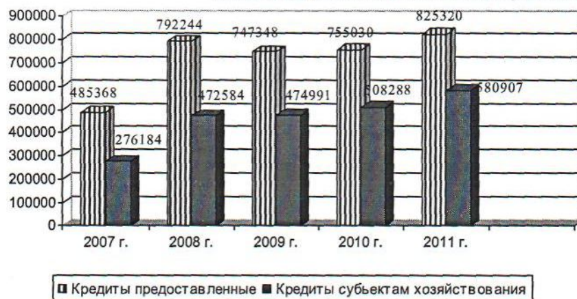
Динамика кредитной активности банков Украины в 2007-2011 гг.. Рис. 1.

Учитывая предназначение и роль коммерческих банков в развитии экономики Украины, для повышения надежности, финансовой стабильности, конкурентоспособности их и банковской системы в целом, необходимо сосредоточиться на следующих направлениях дальнейшего развития: наращивание ресурсной базы и капитала, снижение уровня рискованных банковских операций, улучшения качества активов, в частности, кредитного портфеля, формирование резервов по кредитным операциям в необходимом объеме, повышение уровня профессионализма руководства и банковских работников при кредитном обслуживании заемщиков, увеличение объемов кредитных вложений в наиболее приоритетные отрасли экономики.