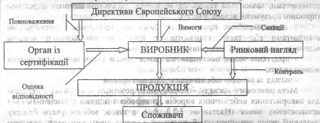
Рис. 7.15. Роль ринкового нагляду у процесі виконання директив «нового підходу»

Функції ринкового нагляду полягають у виконанні попереджувальних дій шляхом здійснення перевірок дотримання виробниками і постачальниками розміщення на ринку лише безпечної продукції, як це передбачено директивою ЄС 2001/95/ЄС «Щодо загальної безпеки продукції». Статтею 6 цієї директиви визначається, що країни-члени співтовариства повинні забезпечувати виконання виробниками і дистриб'юторами вимог цієї директиви, гарантуючи безпеку виробів, розміщених на ринку. Цією ж директивою визначено, що країни-члени утворюють чи призначають органи, які здійснюють постійний контроль за постачанням суб'єктами господарювання на ринок лише безпечних виробів, і надають таким органам необхідні повноваження вживати дії, що визначені директивою. Країни-члени повинні визначати завдання, повноваження та коопераційні угоди компетентних органів (рис. 7.15).